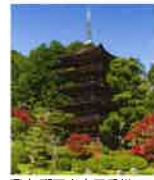
国宝 瑠璃光寺五重塔