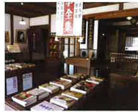
金子みすゞ記念館