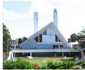
山口サビエル記念聖堂