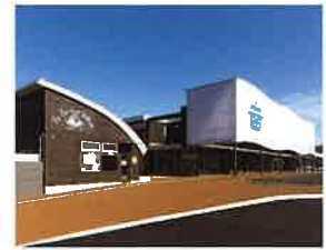
道の駅 センザキッチン